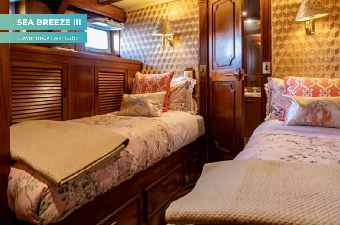
Lower deck twin cabin