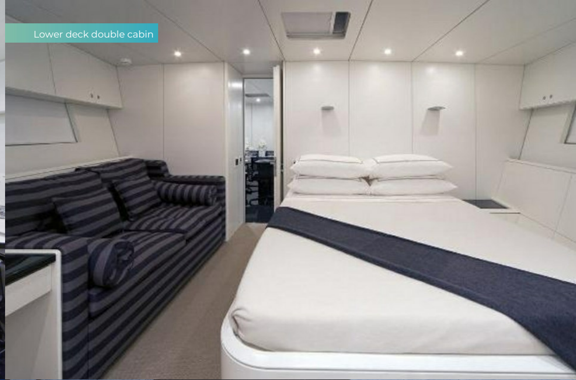
Lower deck double cabin