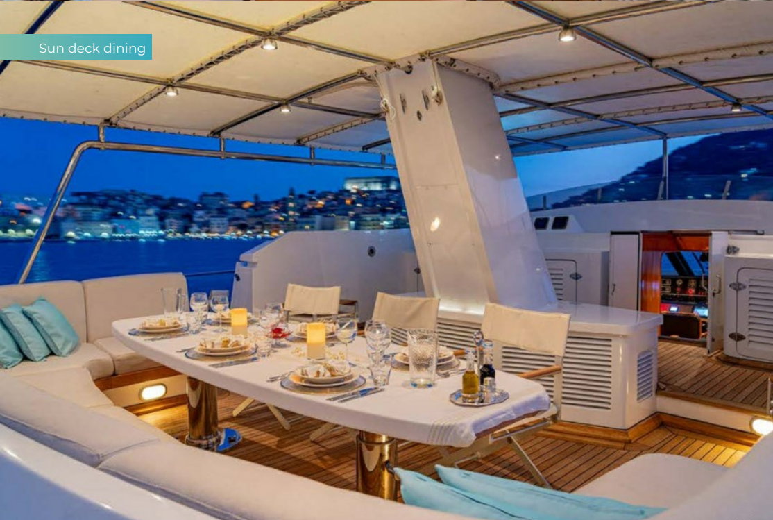
Sun deck dining