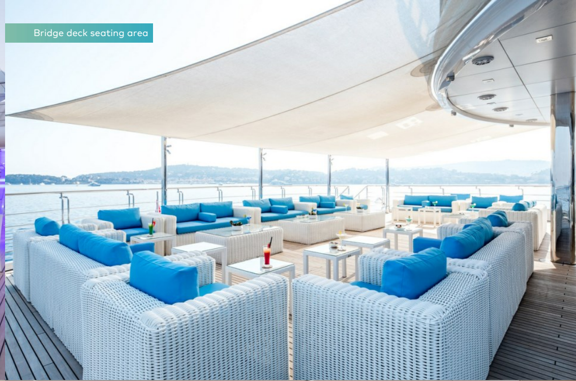
Bridge deck seating area