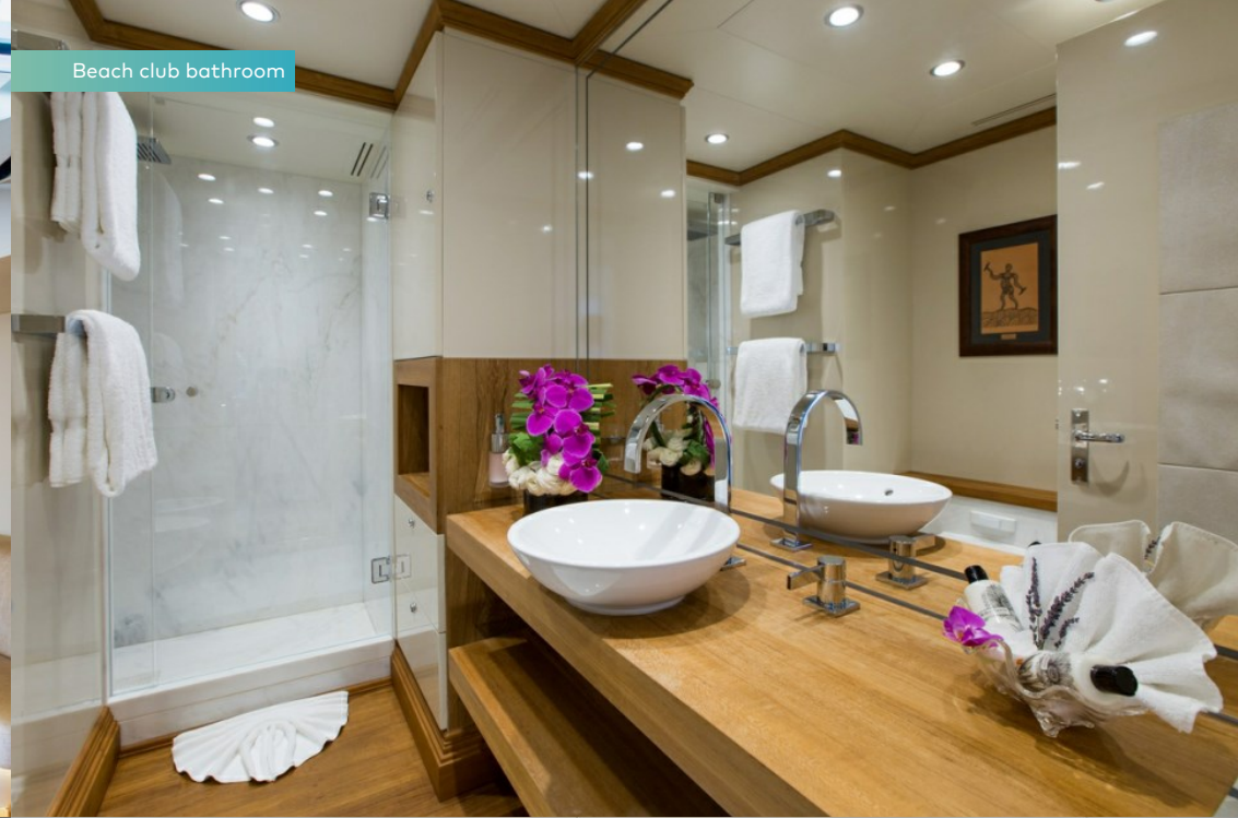
Beach club bathroom