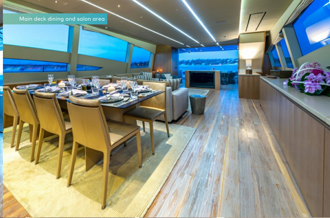
Main deck dining and salon area