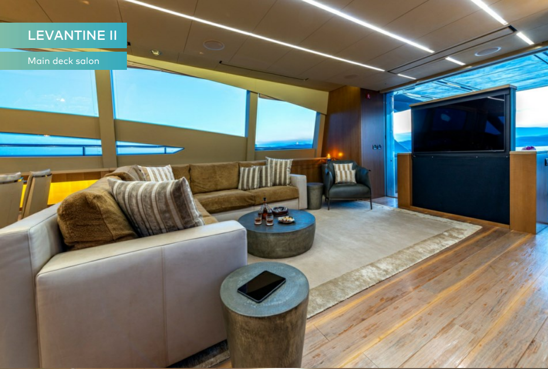
Main deck salon