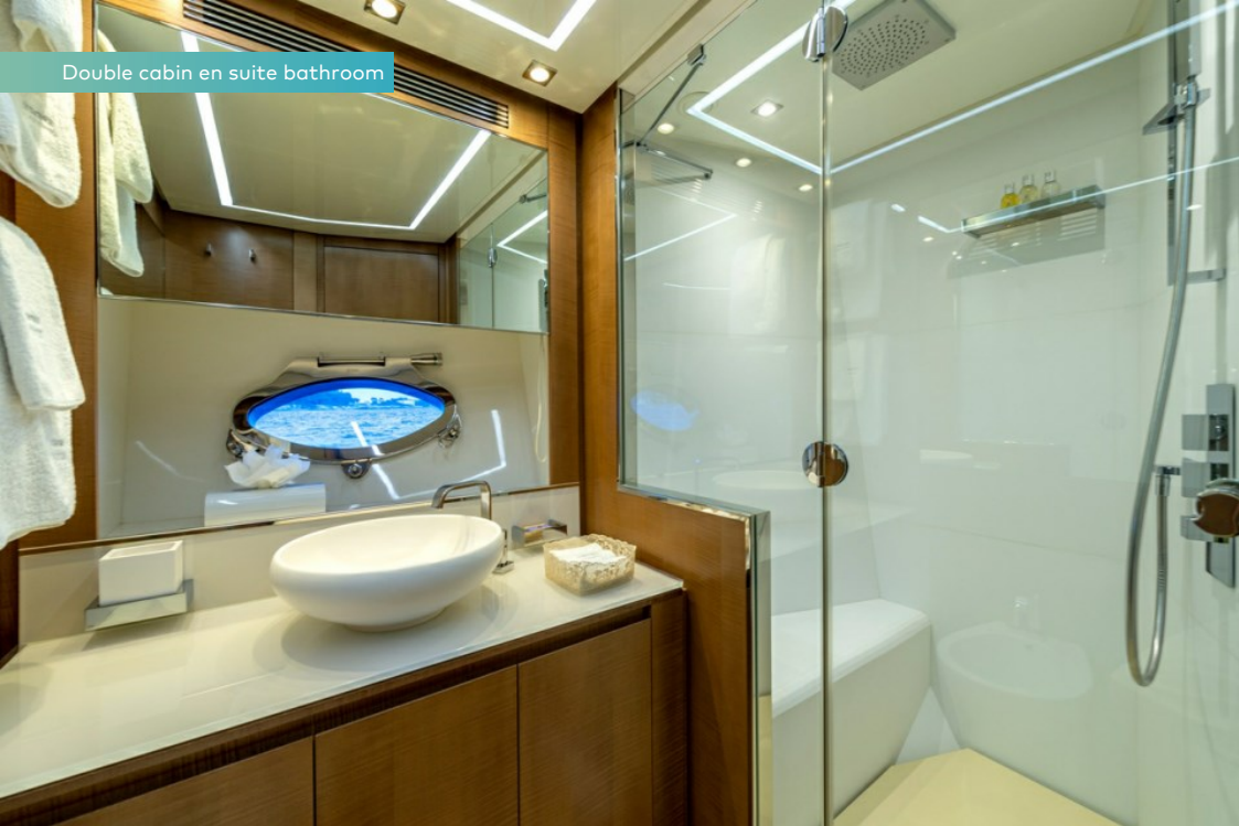
Double cabin en suite bathroom