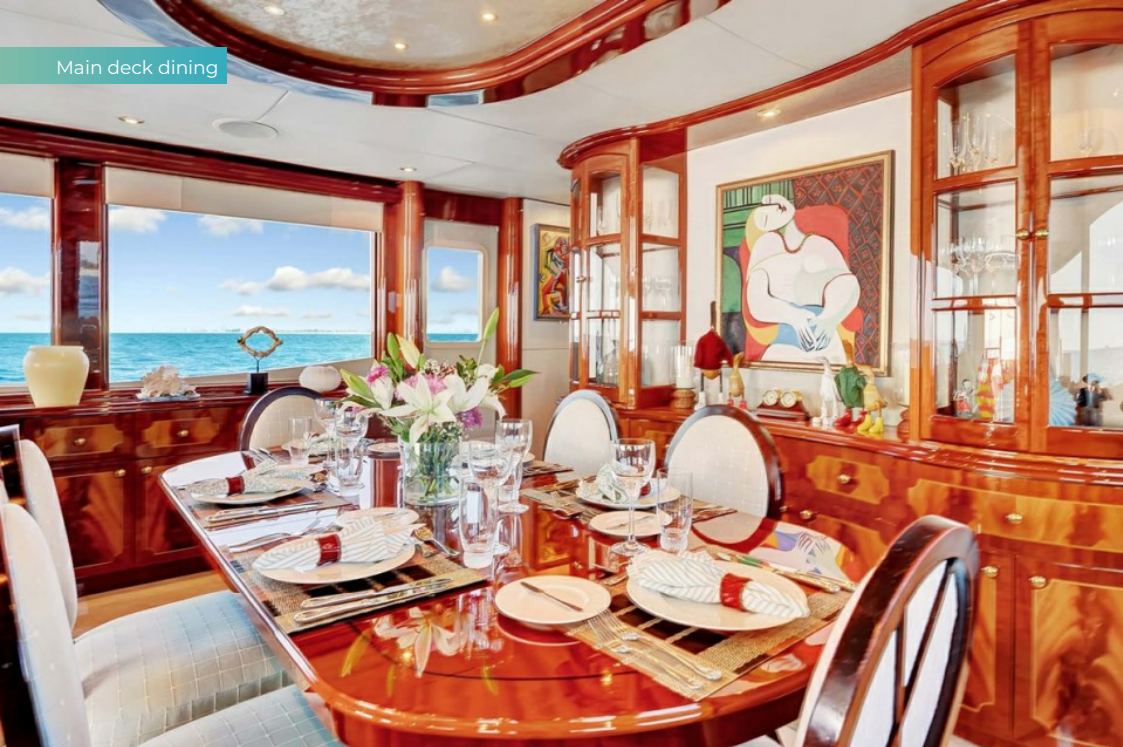
Main deck dining