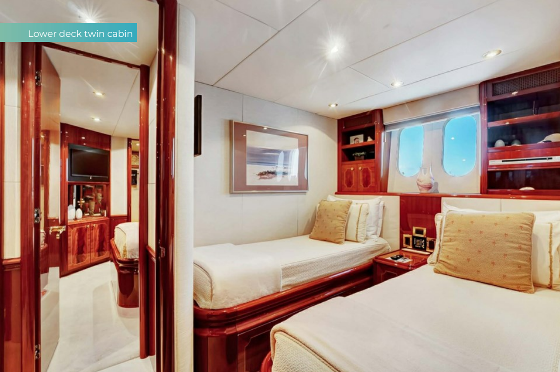
Lower deck twin cabin