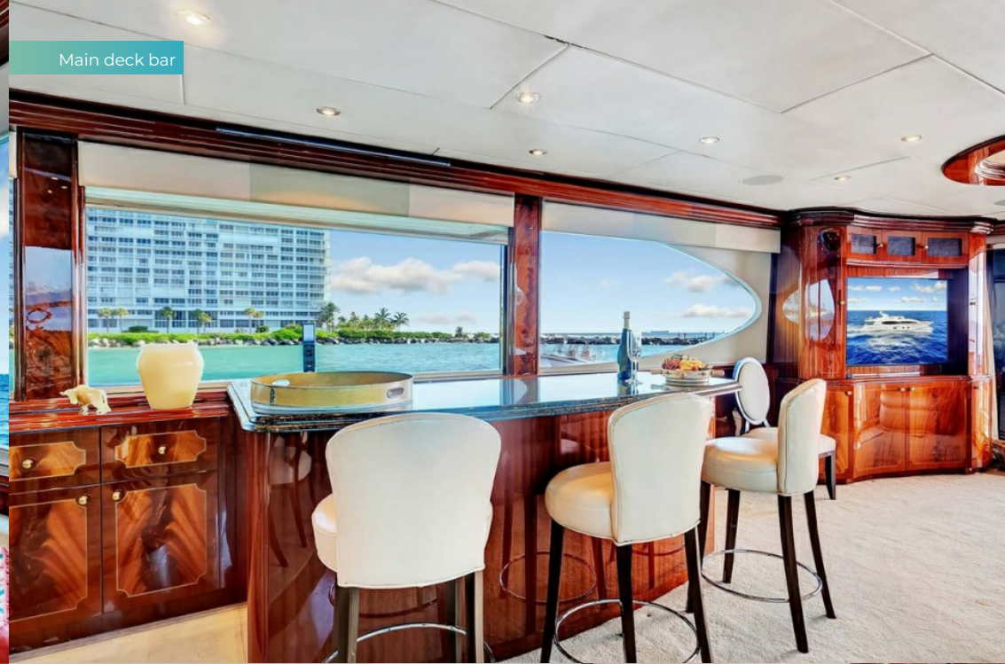
Main deck bar