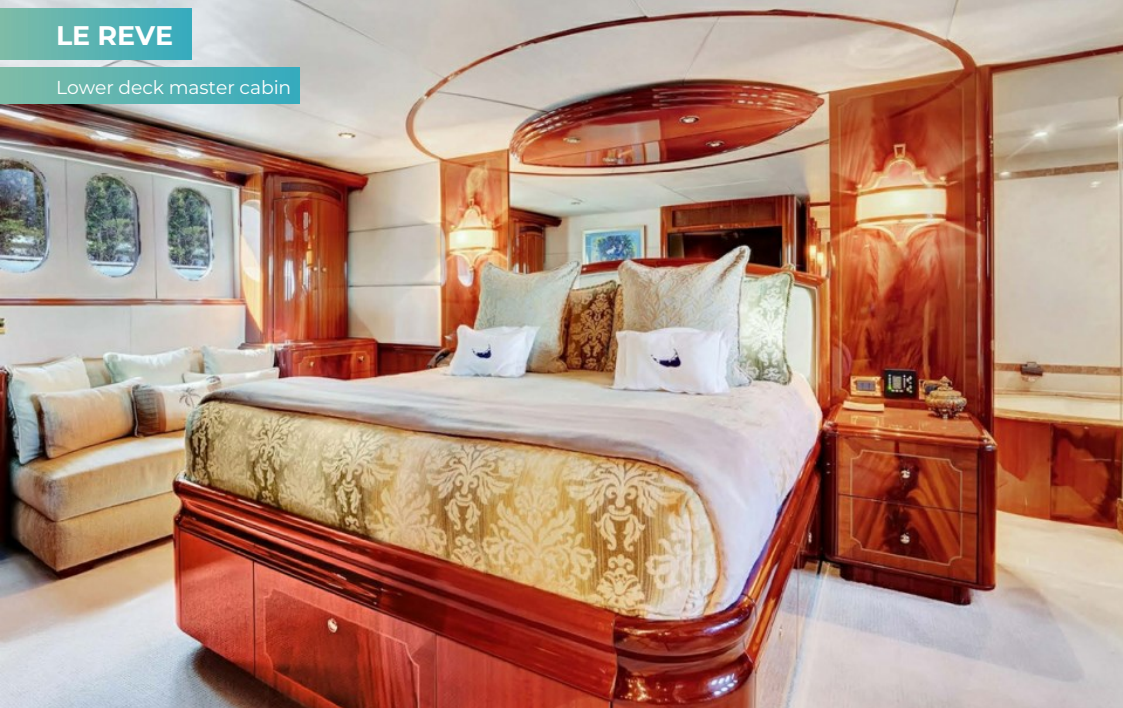
Lower deck master cabin