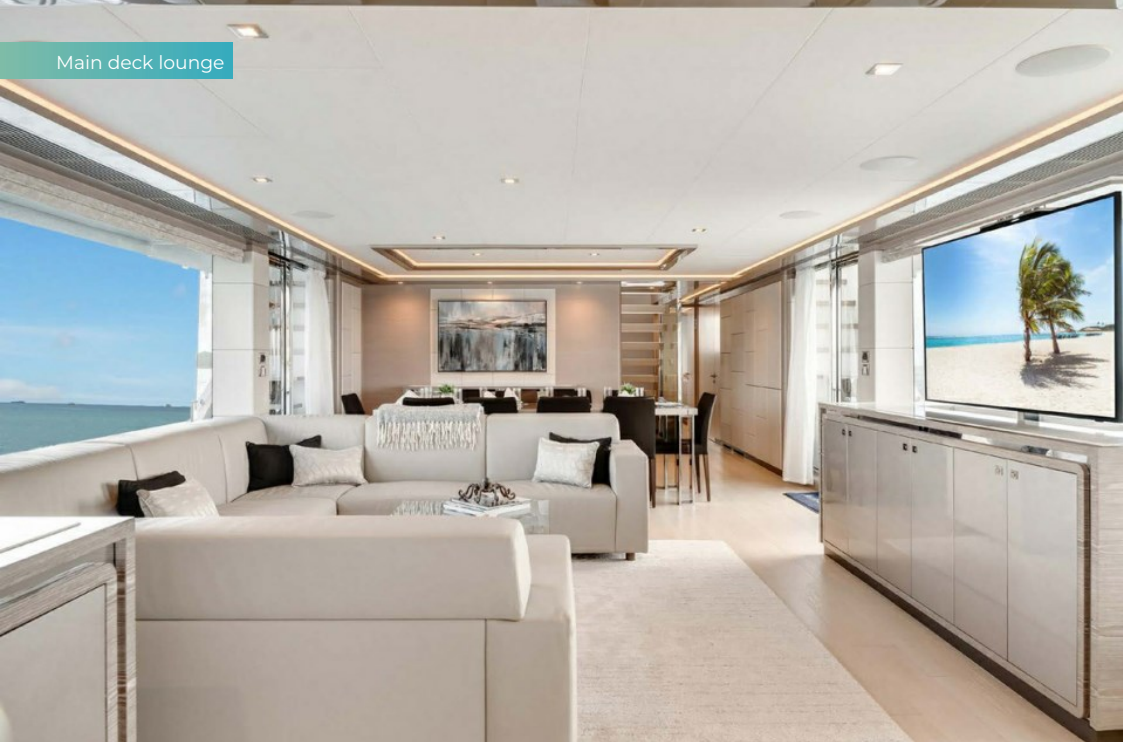
Main deck lounge