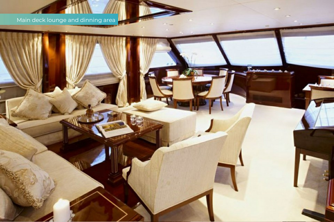
Main deck lounge and dining area