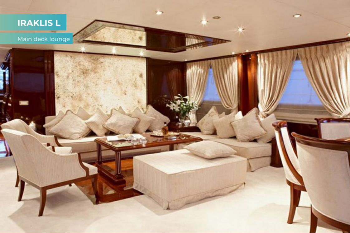
Main deck lounge