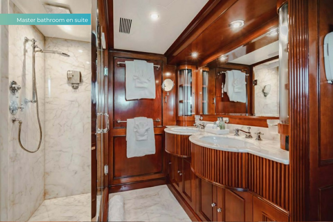
Master bathroom en suite