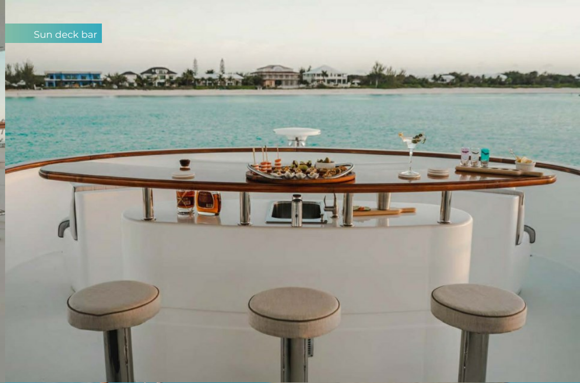
Sun deck bar