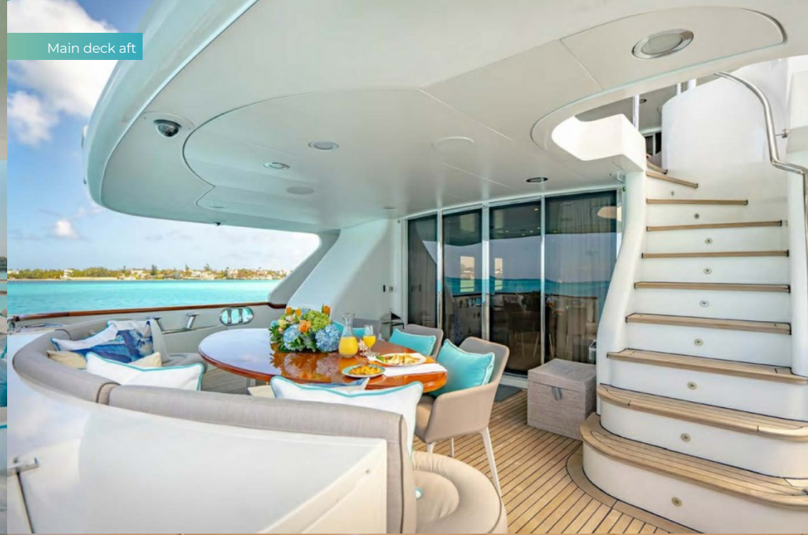
Main deck aft