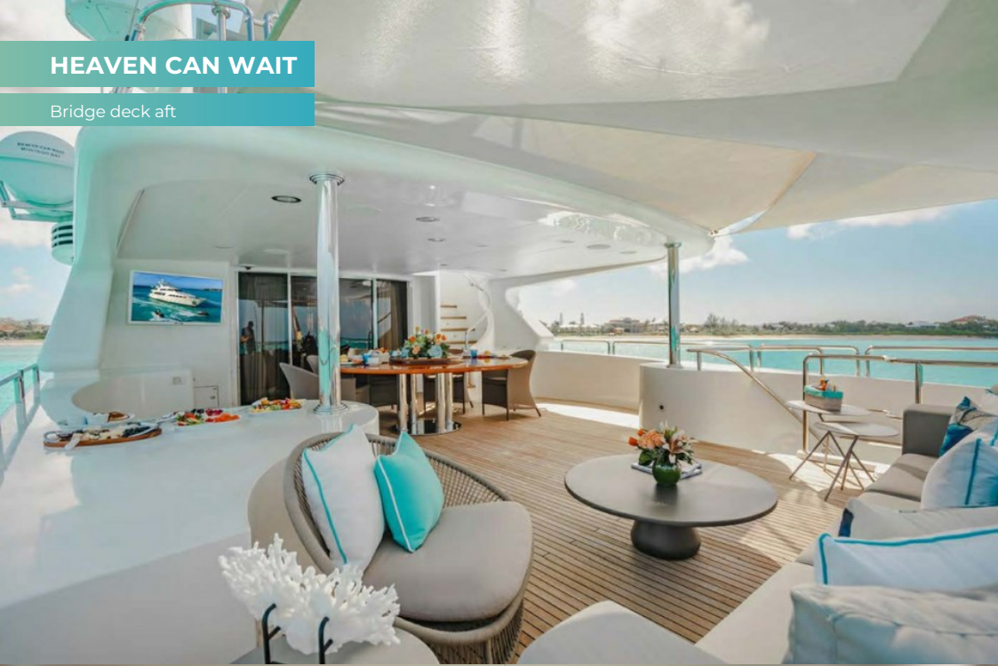
Bridge deck aft