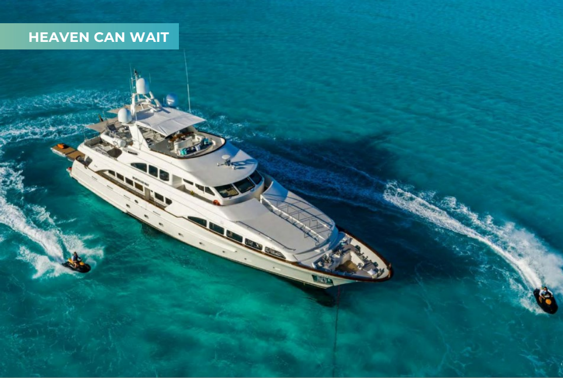
HEAVEN CAN WAIT