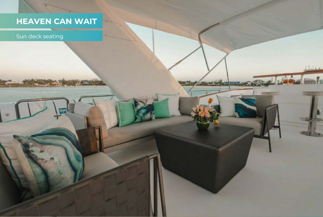
Sun deck seating