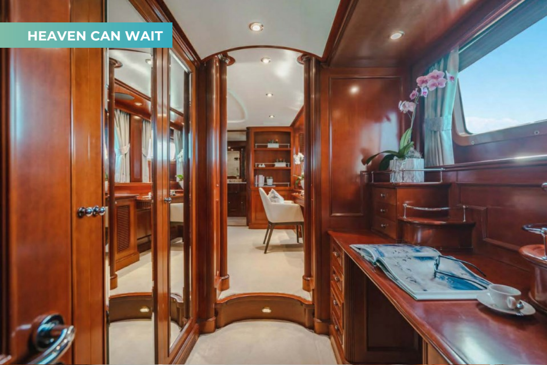
HEAVEN CAN WAIT