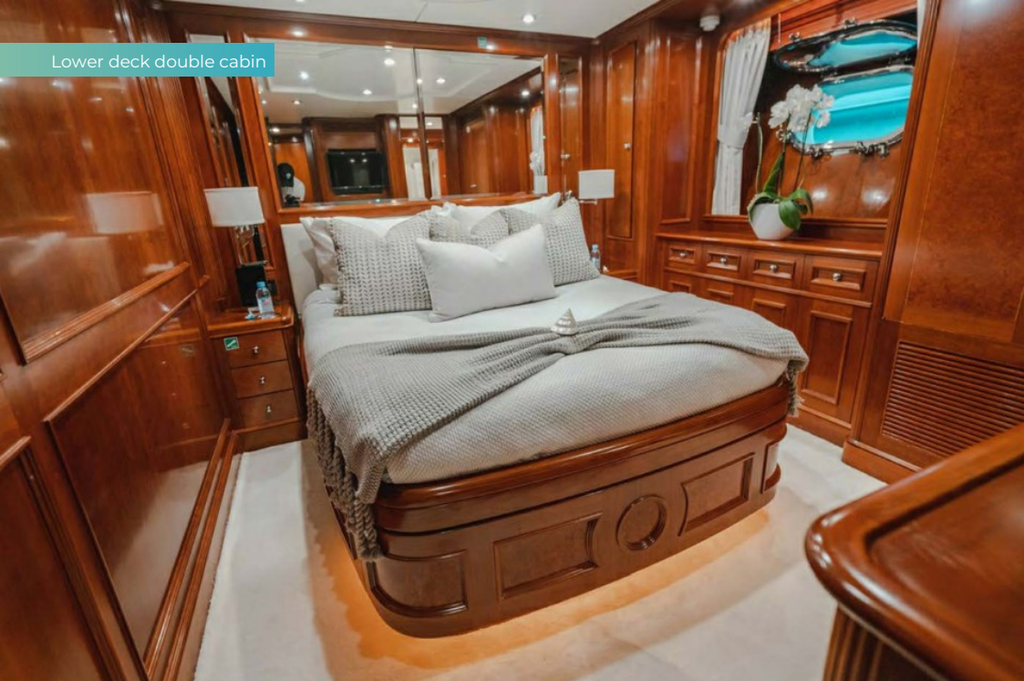
Lower deck double cabin