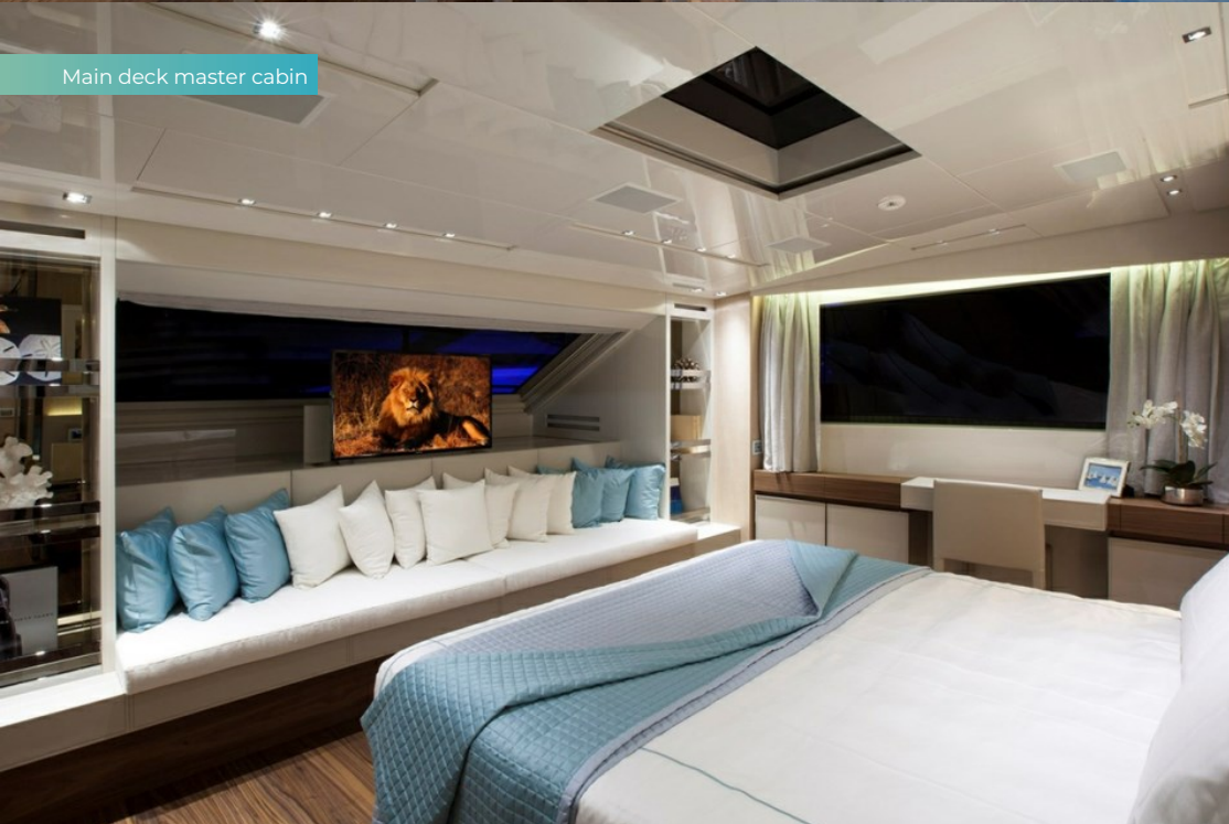
Main deck master cabin