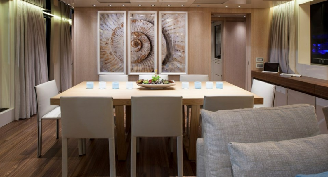
Main deck dining