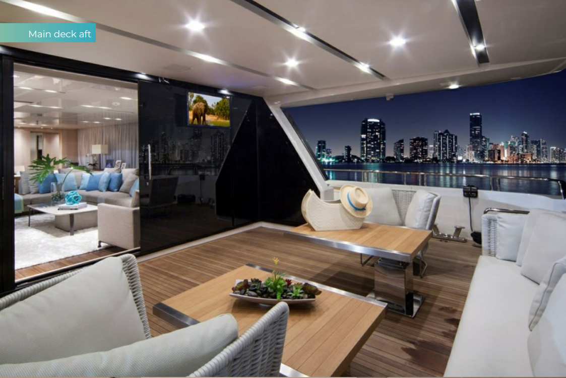
Main deck aft