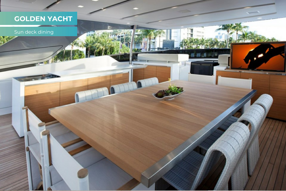
Sun deck dining