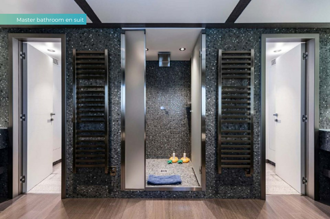
Master bathroom en suit