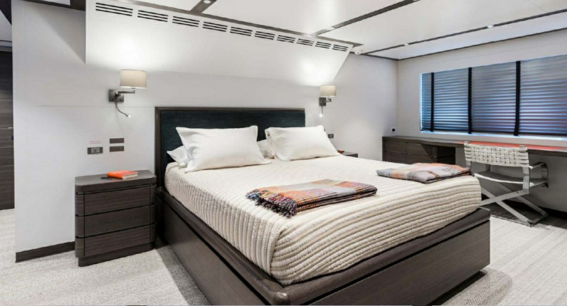
Upper deck master cabin