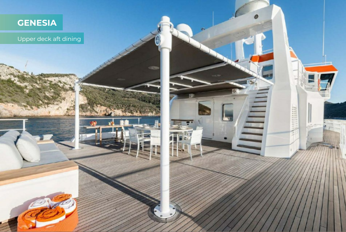
Upper deck aft dining