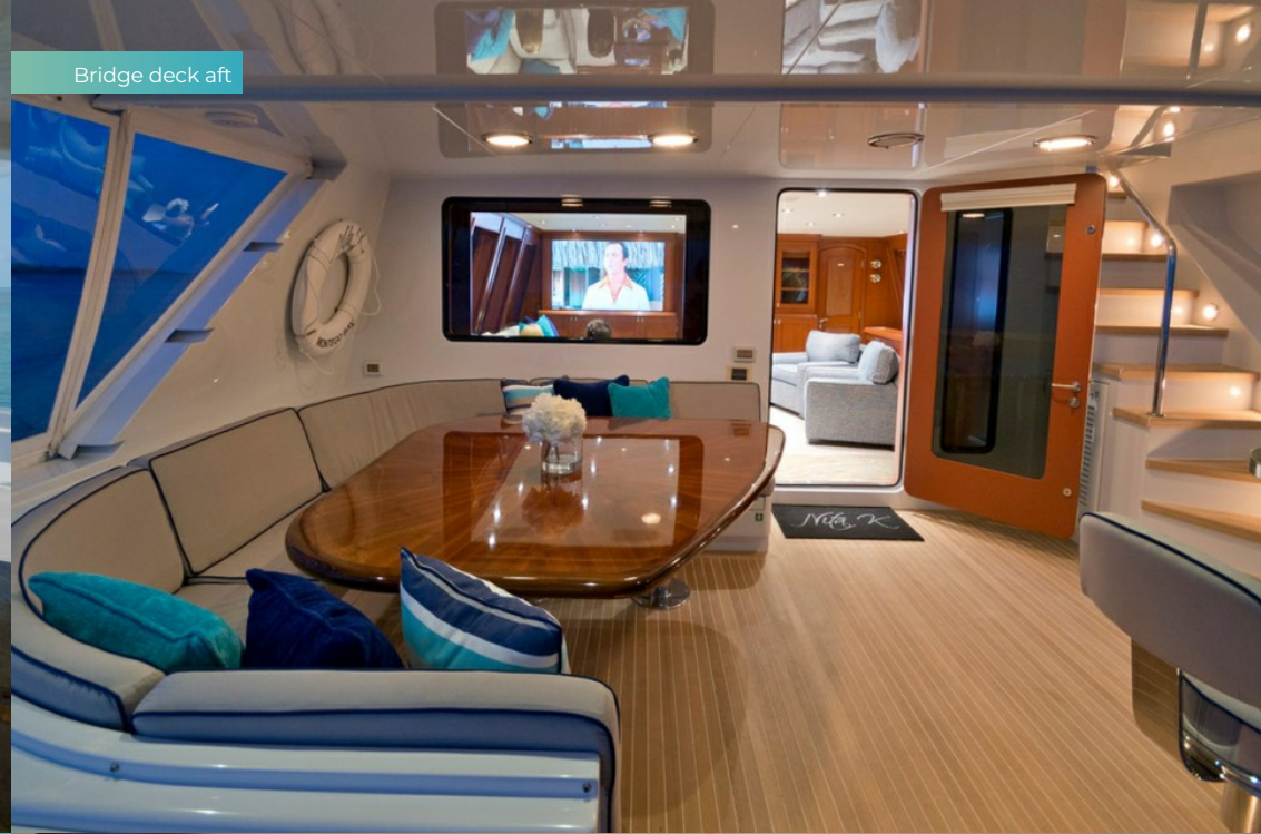
Bridge deck aft