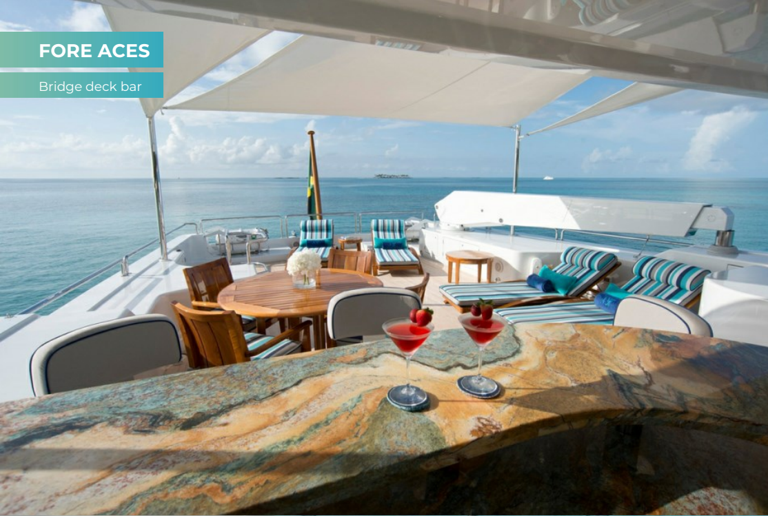
Bridge deck bar