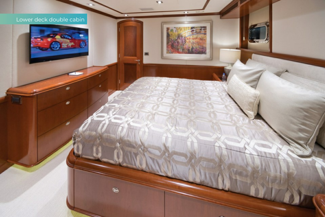
Lower deck double cabin