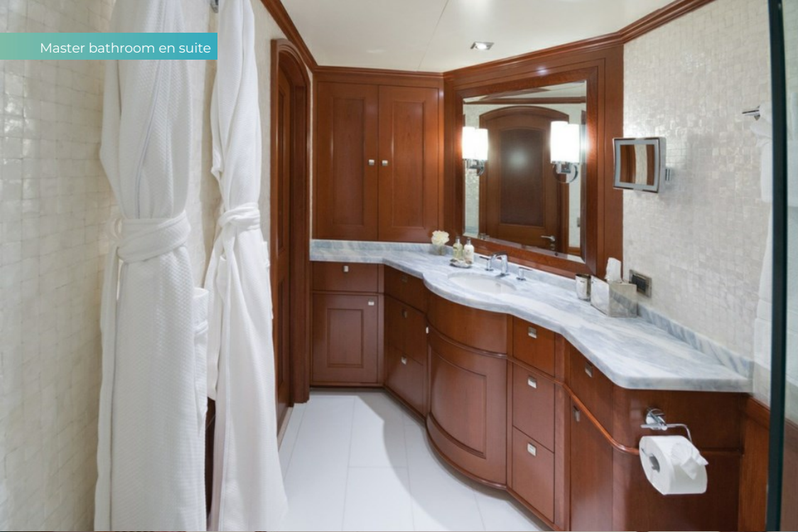
Master bathroom en suite