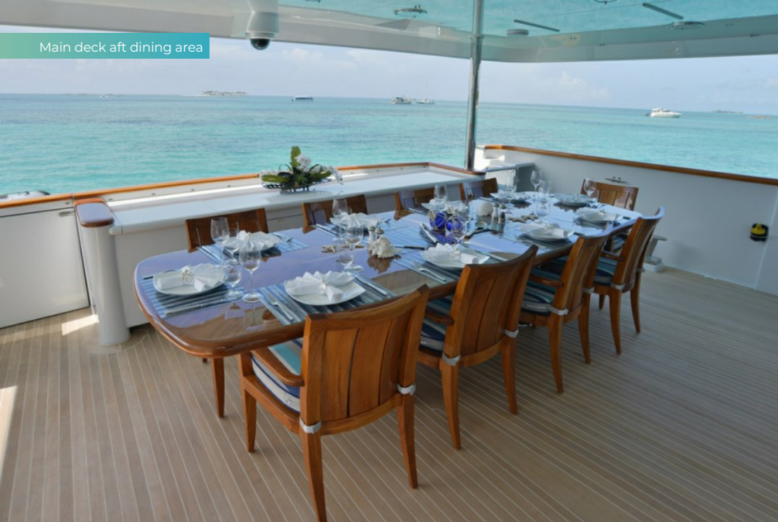
Main deck aft dining area