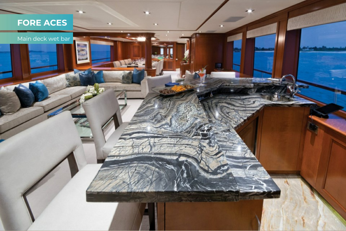
Main deck wet bar