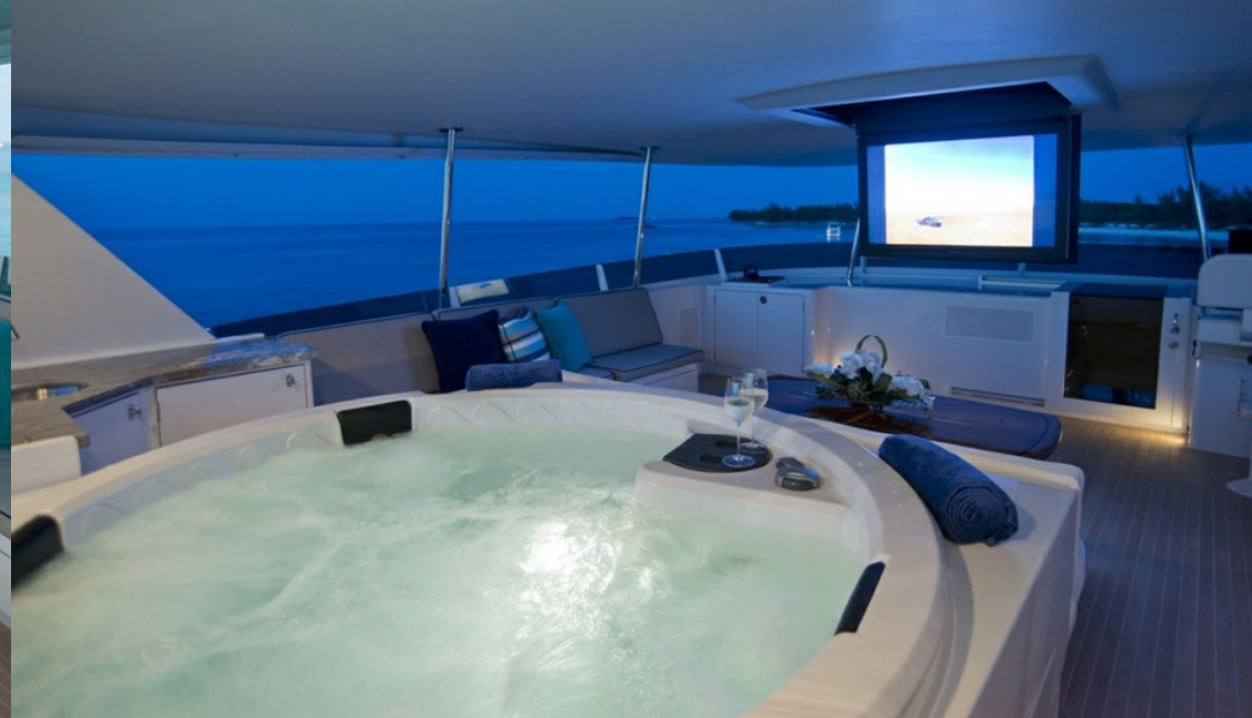
Sun deck jacuzzi