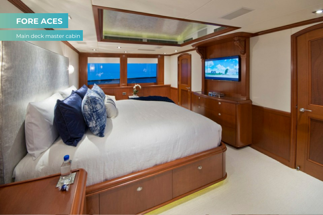
Main deck master cabin