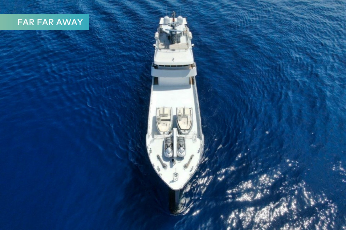
FAR FAR AWAY