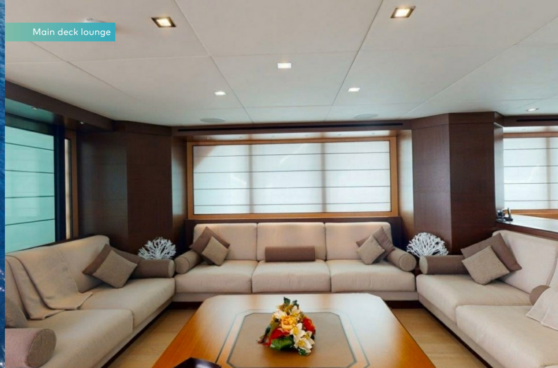
Main deck lounge