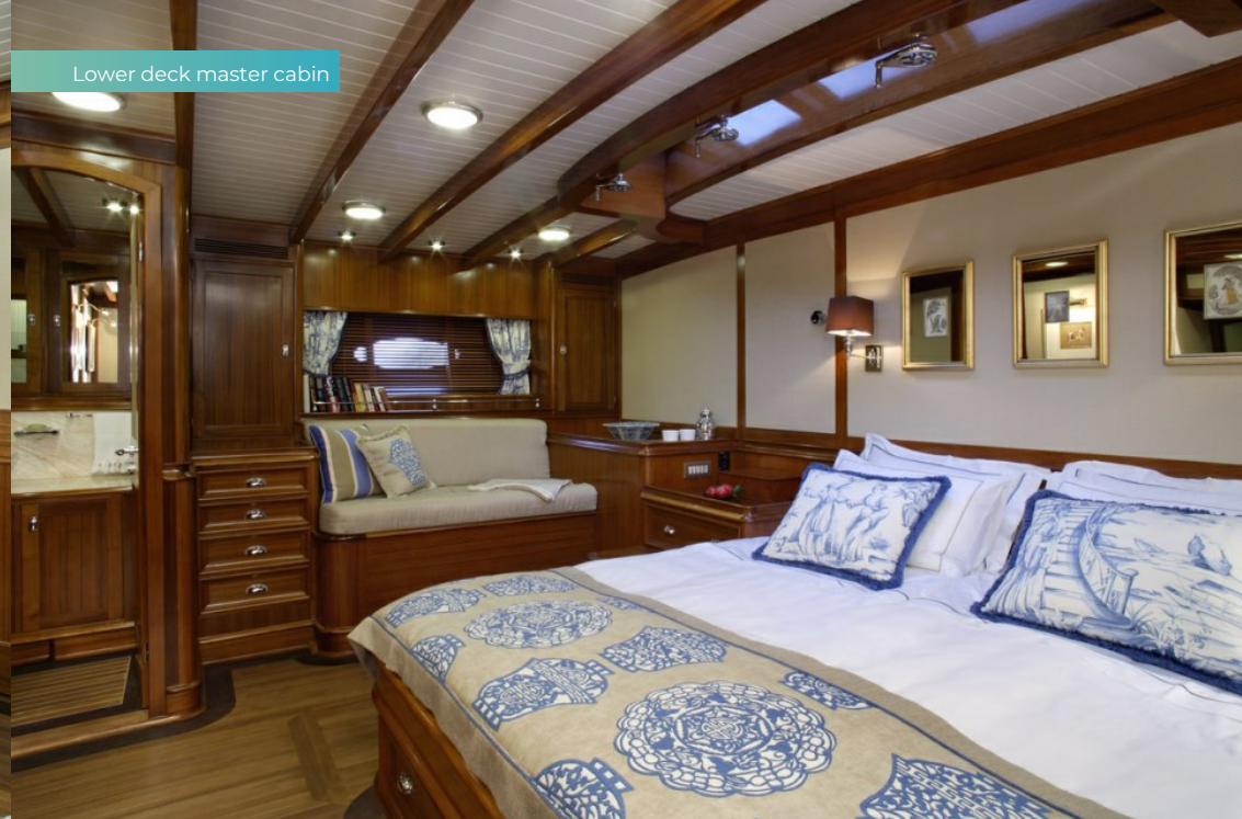
Lower deck master cabin