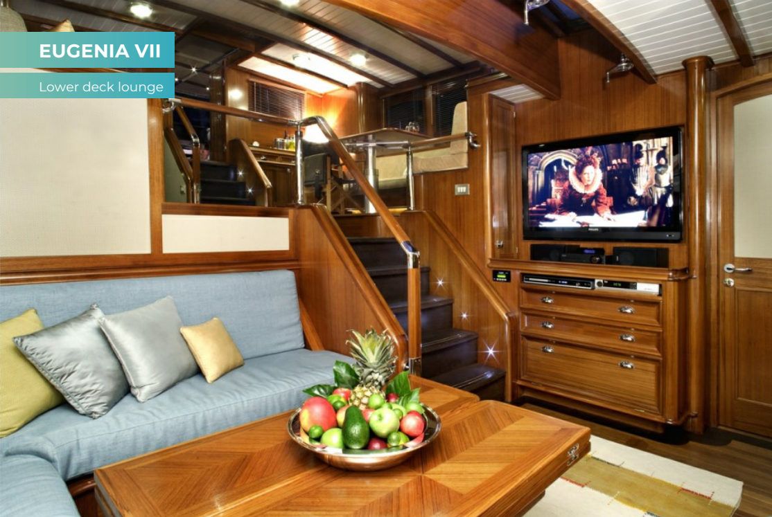
Lower deck lounge