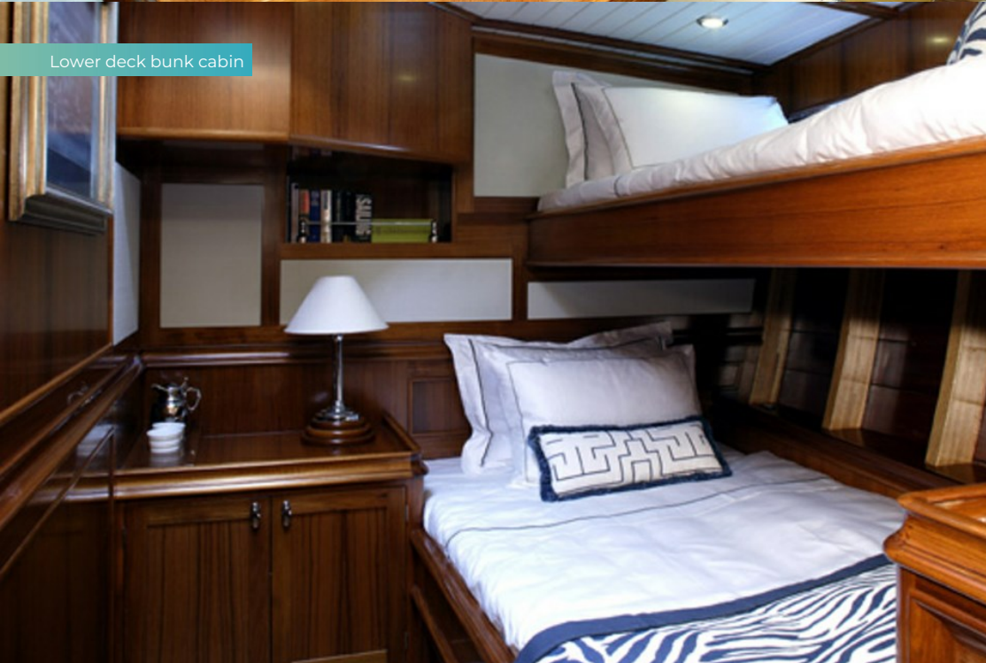
Lower deck bunk cabin