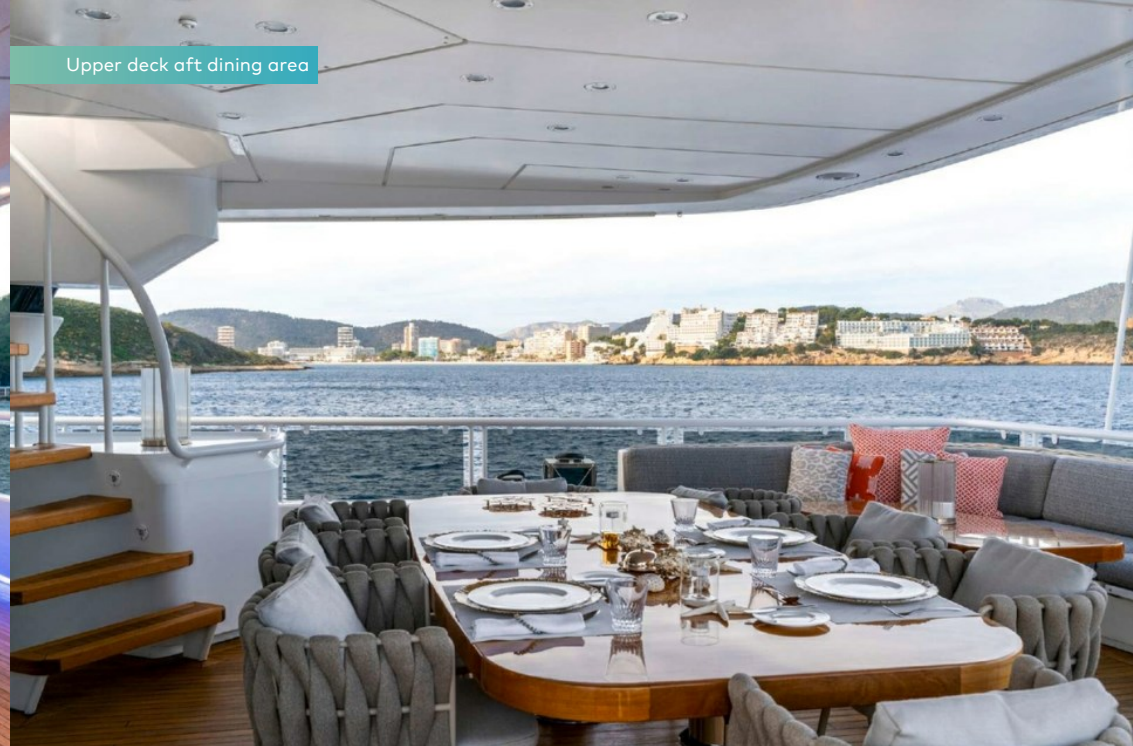
Upper deck aft dining area