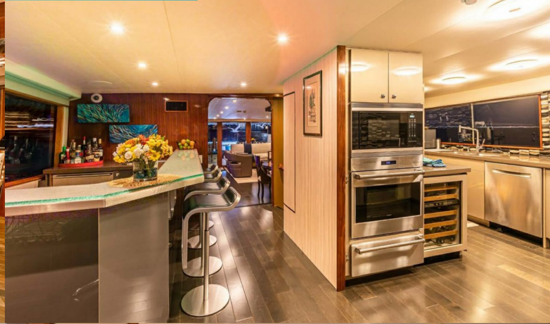
Main deck bar and open plan galley