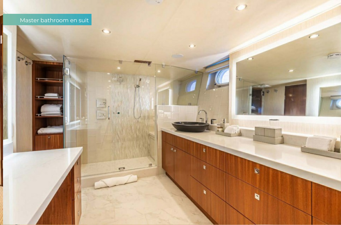
Master bathroom en suit