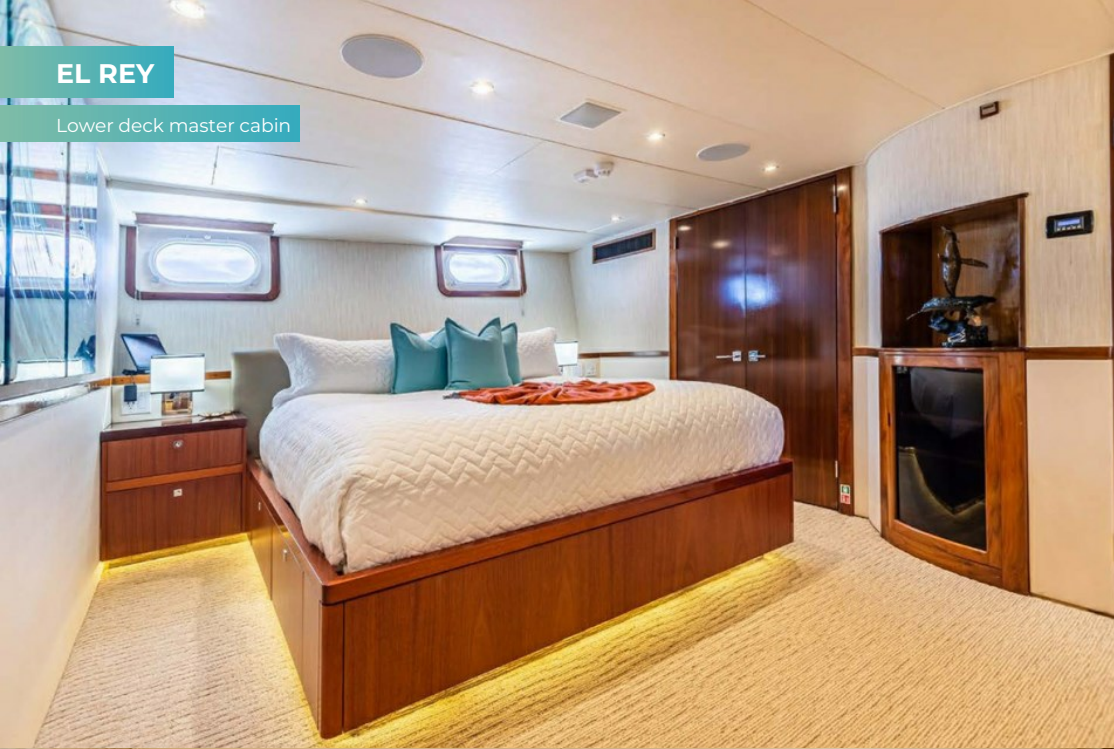
Lower deck master cabin