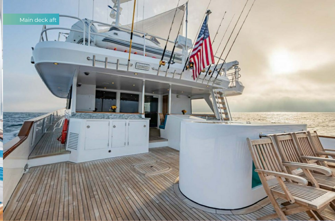
Main deck aft