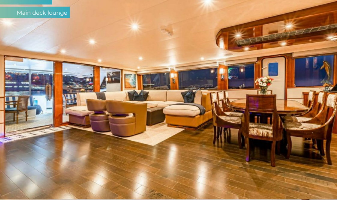
Main deck lounge