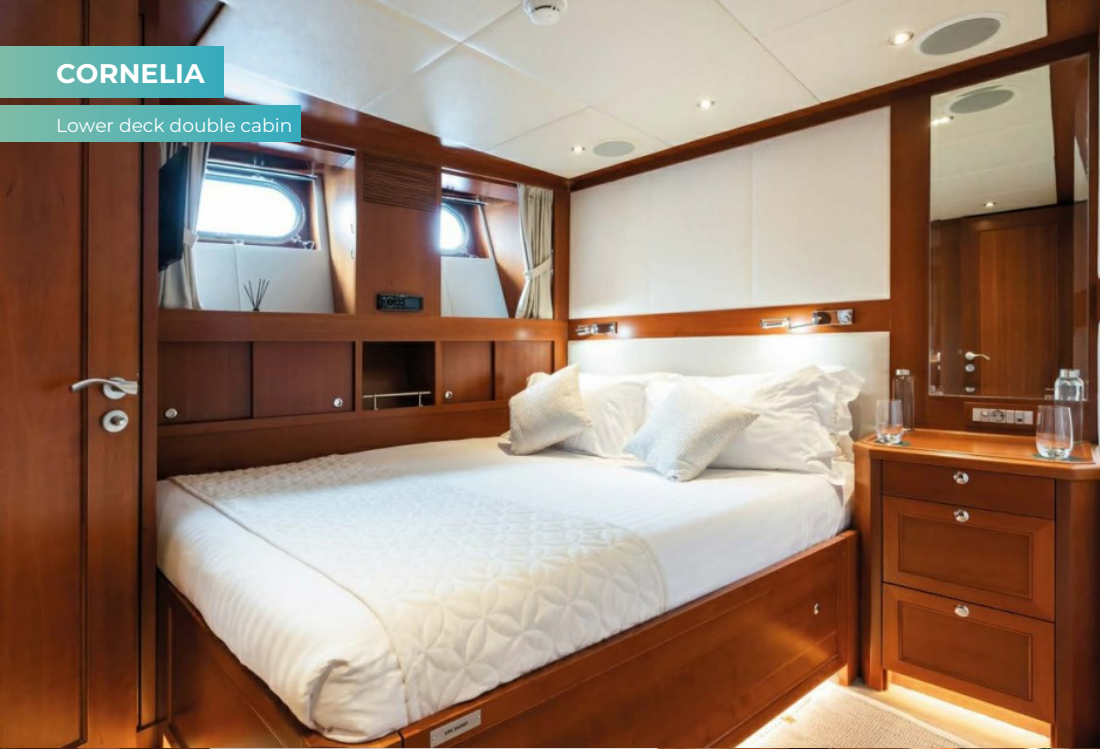
Lower deck double cabin