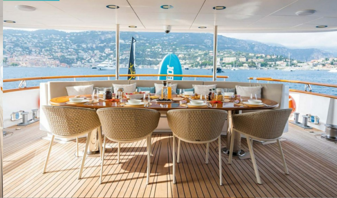
Main deck aft