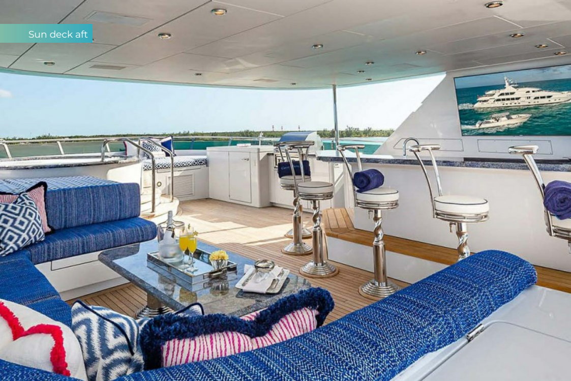
Sun deck aft