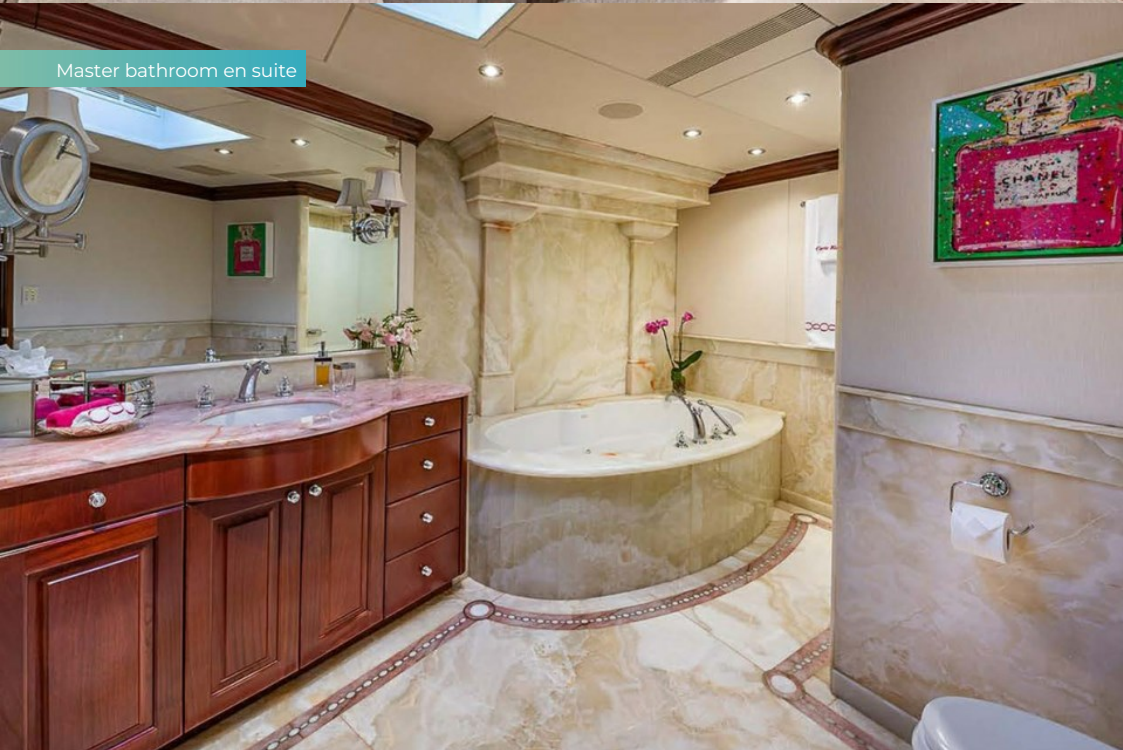
Master bathroom en suite