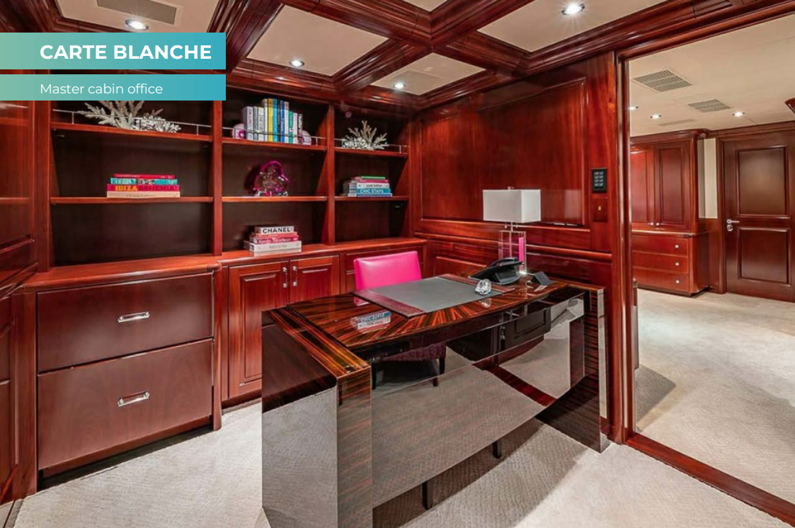
Master cabin office