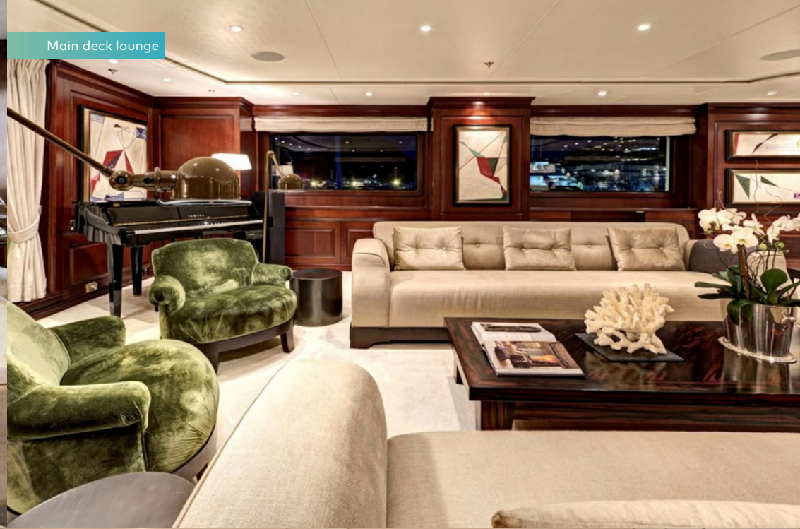
Main deck lounge