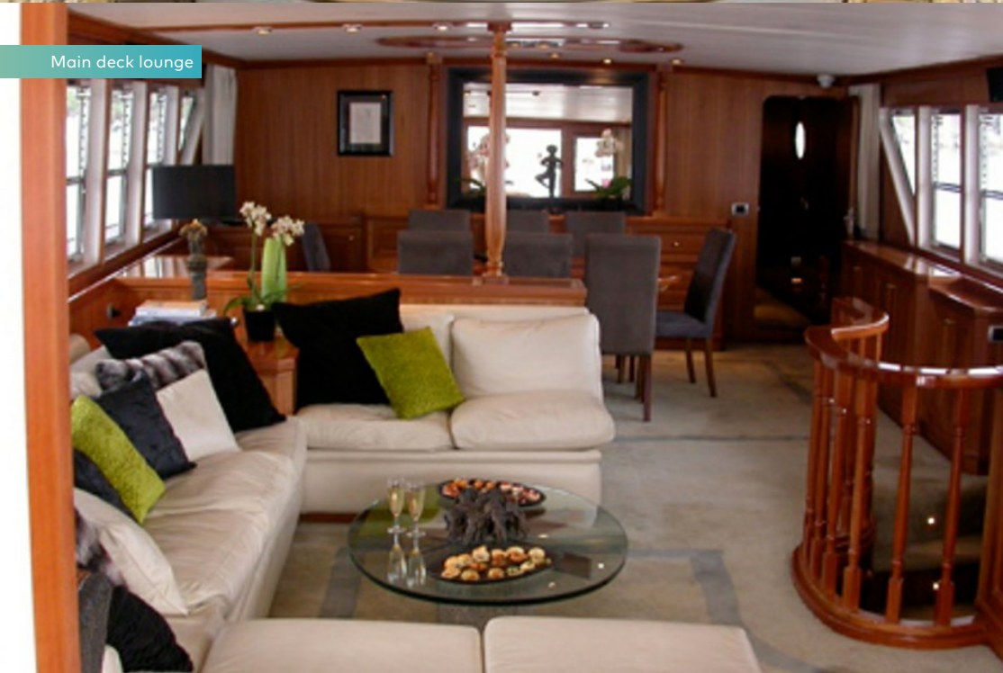
Main deck lounge