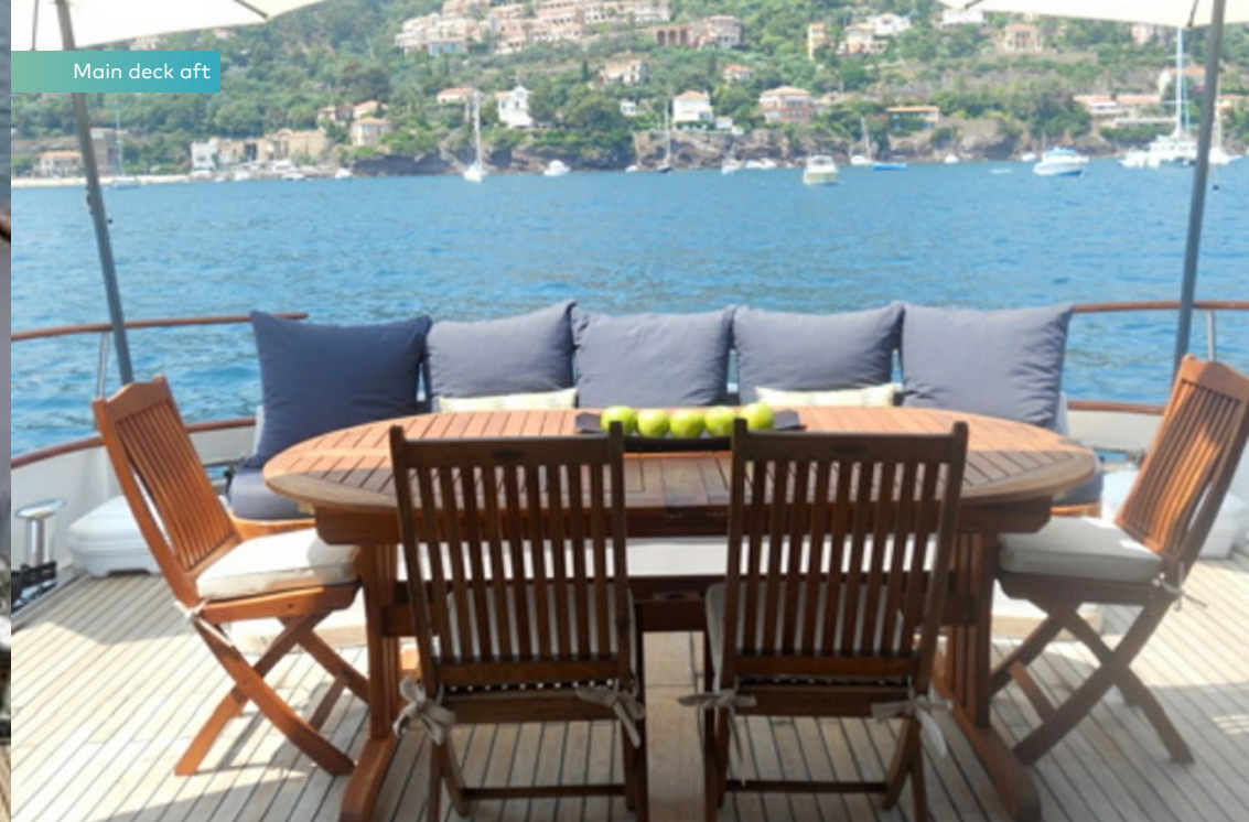
Main deck aft