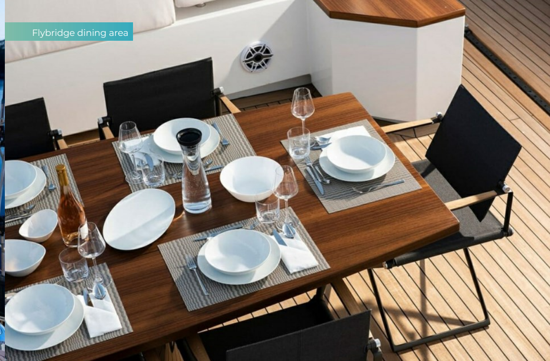
Flybridge dining area