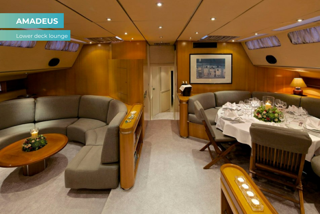
Lower deck lounge