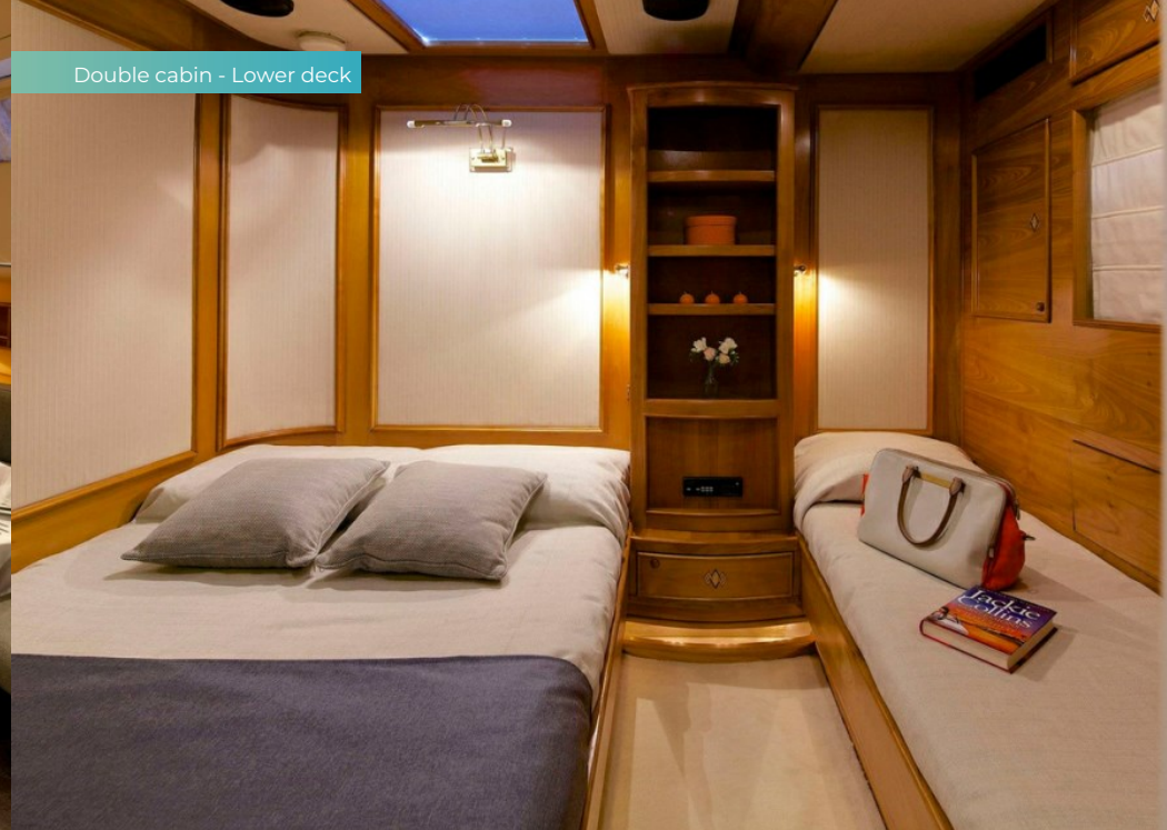
Double cabin - Lower deck